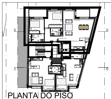
PLANTA DO PISO