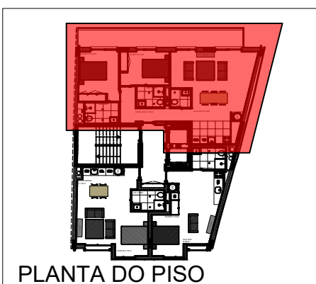
PLANTA DO PISO