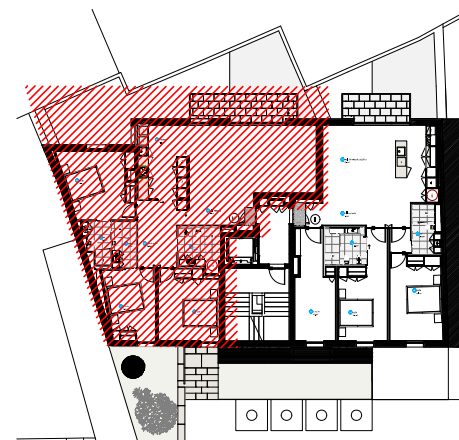
planta geral piso 3